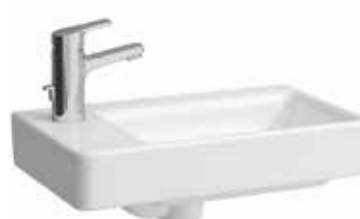
Umývátko 48×28 – levé