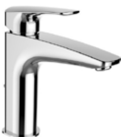
Umyvadlová baterie – Laurin