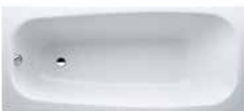
Vana 170×75 cm