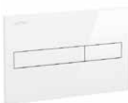
Splachovací tlačítko – bílá