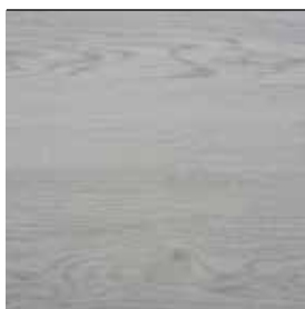
Dub světle šedý