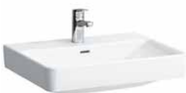
Umyvadlo 60×46 cm