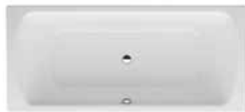
Vana 180×80 cm