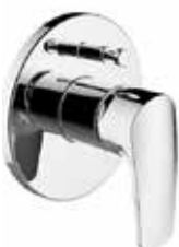
Baterie vanová, sprchová – Laurin