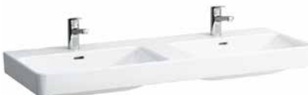
Dvojumyvadlo 120×46 cm