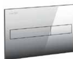
Splachovací tlačítko – chrom