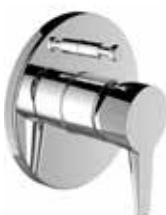
Baterie vanová, sprchová – Val