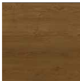
Dub tmavě hnědý