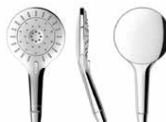
Vanové a sprchové příslušenství Laufen Mytwin